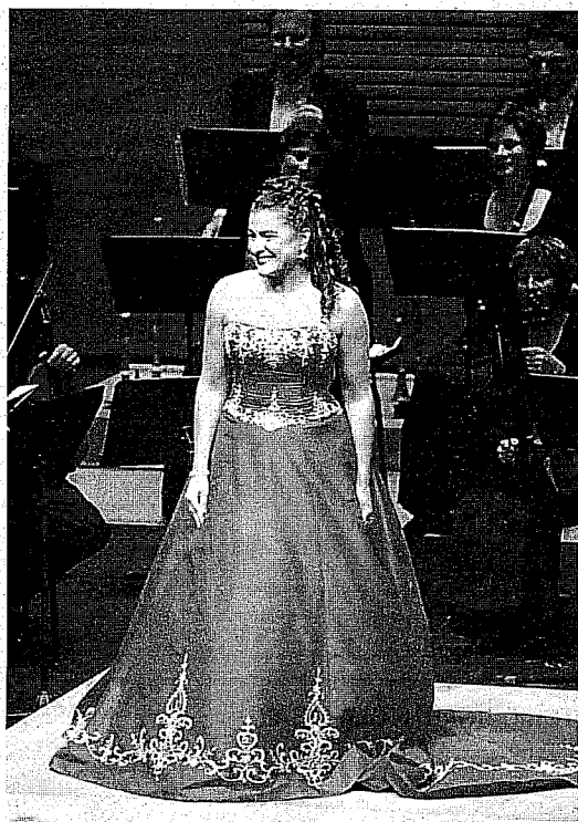
Cecilia Bartoli lució un espectacular vestido rojo.